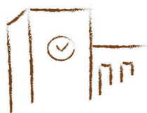
Liceum Ogólnokształcące im. A. Mickiewicza w Górze

Jestem przekonana, że każdy, kto świadomie wybiera Liceum Ogólnokształcące im. Adama Mickiewicza w Górze, otrzymuje pełną możliwość realizacji przyszłych planów życiowych.