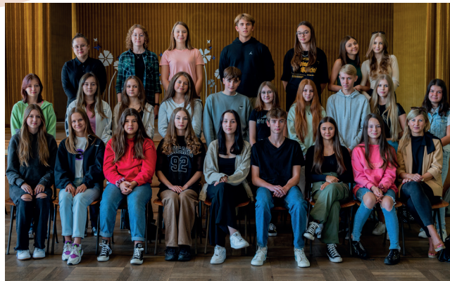
KLASA I B W ROKU SZKOLNYM 2022/23