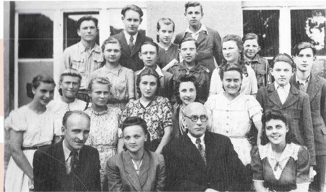
KLASA I B W ROKU SZKOLNYM 1945/46

„Młodości! tobie nektar żywota Natenczas słodki, gdy z innymi dzielę: Serca niebieskie poi wesele, Kiedy je razem nic powiąże złota. Razem, młodzi przyjaciele!”